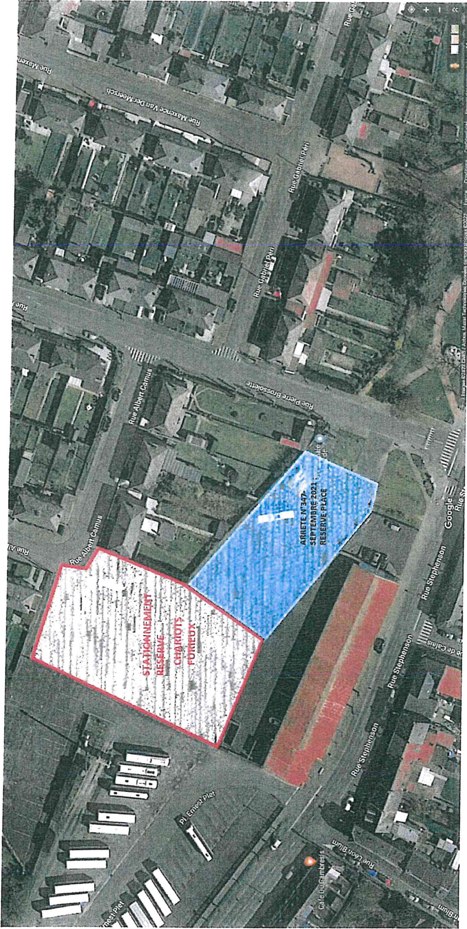
STATIONNEMENT - LES CHARIOTS FURIEUX - ESPLANADE DU CAMBRESIS