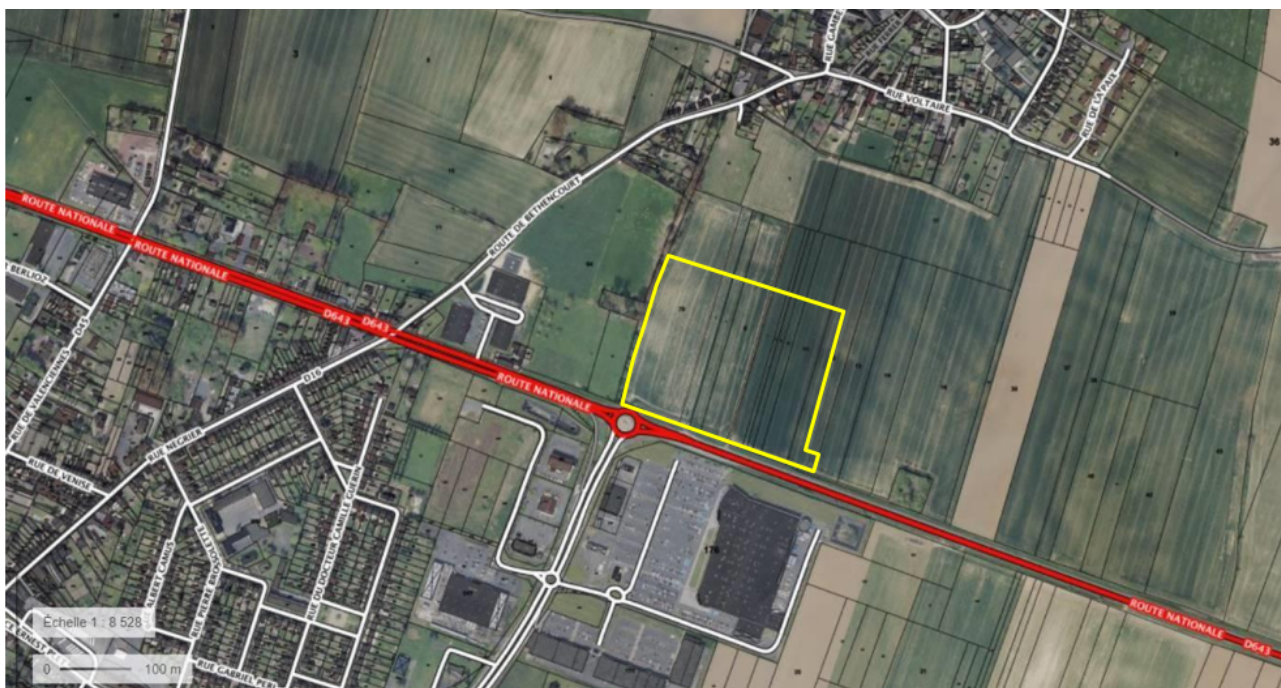
Localisation de l'extension de la zone commerciale

Cet ensemble commercial constitue une extension du centre commercial Leclerc existant situé de l'autre côté de la route départementale 643.